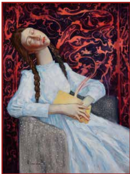
YU JIN, Il mondo dei sogni , olio su tela